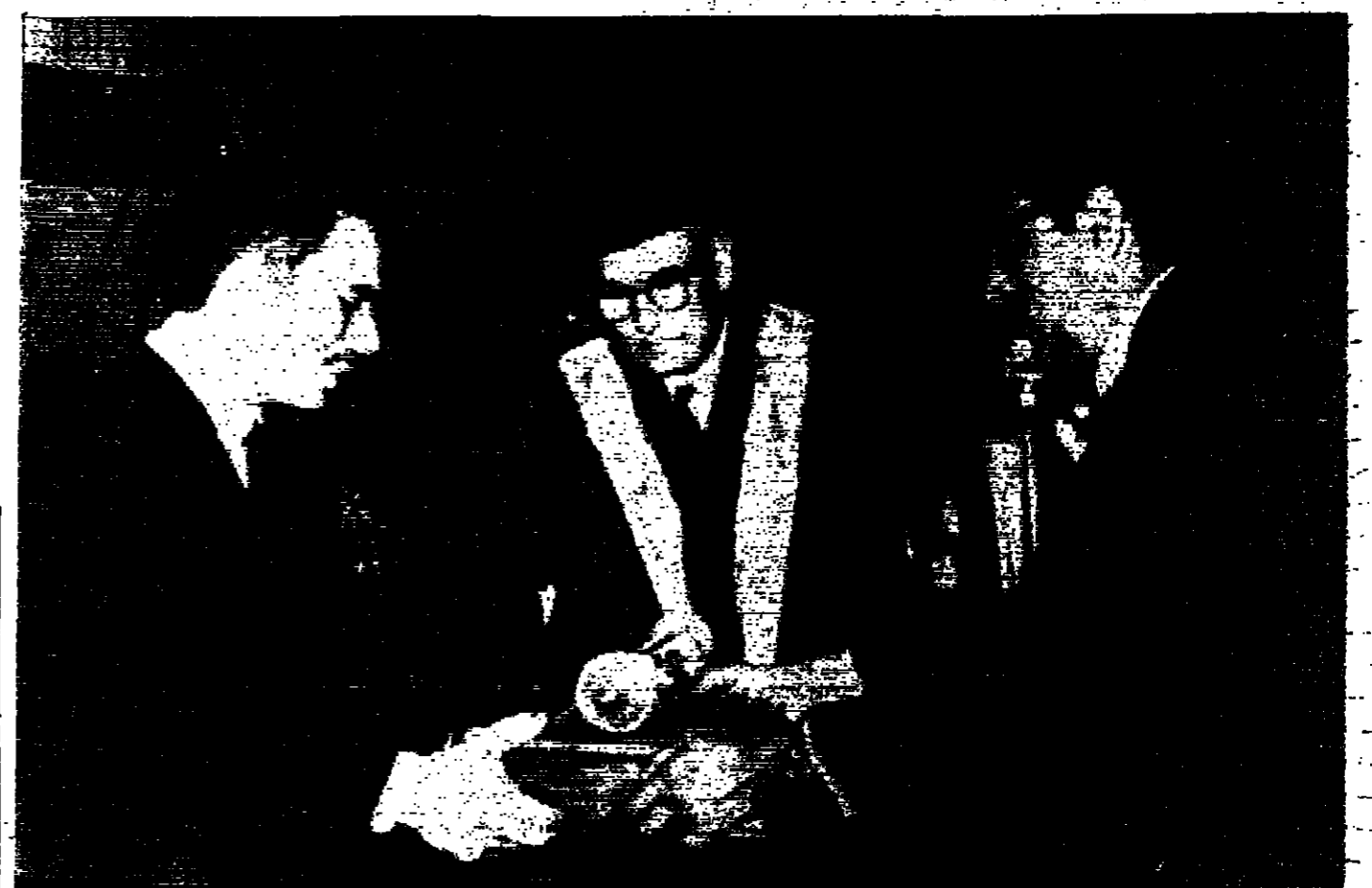
جلالة الملك الحسين العظيم يتلقى شهادة الشكر من جامعة الفتح في لاهور - في الوسط بكلمة باكستان الشرقية والى اليمين - من قبل الجامعة

البيان المشترك الزعيمان أكد ضرورة الالتحاق بالقوى القوية عمان - ١١ - صدر في عمان ورواندي ظهر امس البيان المشترك التالي: قام حضرة صاحب الجلالة الملك حسين العظيم ملك المملكة الأردنية الهاشمية بناء على دعوة المشر محمد ايوب خان رئيس جمهورية باكستان رسيبة الى جمهورية باكستان الاسلامية من ٢٦ يناير (كثون الثاني) الى ١ فبراير (شباط) وحيثما توجه جلالتهم ومرافقوه كقوة يتفادون بالتحريبات الحار من قبل الشعب الباكستاني لتعبيرا عن محبتهم وتقديرهم لجلالتهم وللشعب الأردني. وخلال زيارته لباكستان قام حضرة صاحب الجلالة بزيارة رواندي وبيشاور ولاهور ونكا وشينكونغ وكراشي حيث التقية على الصفحة الرابعة عمود ٨